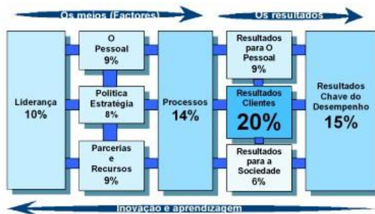
Fig. 1 – Modelo de Excelência da EFQM – Critérios e peso

Pela modelização representada na imagem supracitada (Figura 1) verifica-se que os cinco fatores terão um peso de 50% assim como os quatro resultados. Procurando uma maior explicitação do assunto, de seguida (Quadro2), nomeiam-se os aspetos que modelam uma empresa.