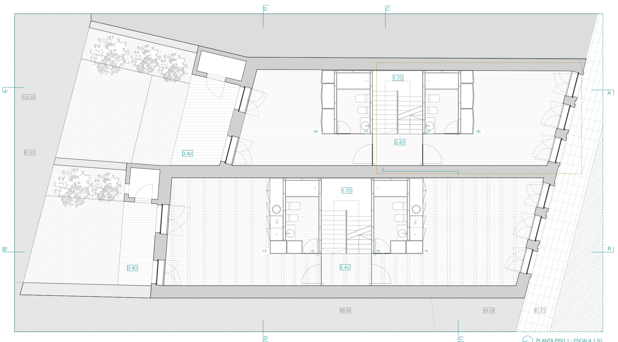
PLANTA PISO 1 - ESCALA 1.50