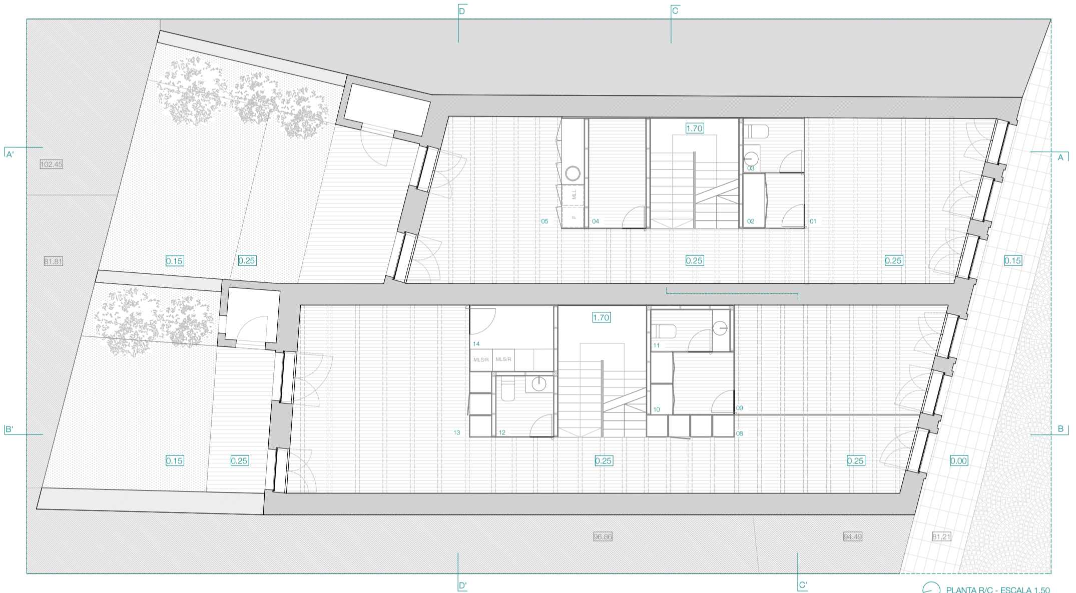
PLANTA R/C - ESCALA 1.50