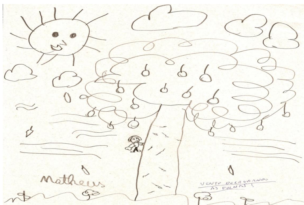
Figura 3 – Desenho da Arvore Generosa

Dessa forma, a leitura da história procurou valorizar o descobrir, o criar e o interpretar situações, o que favorecerá o gosto pela leitura.