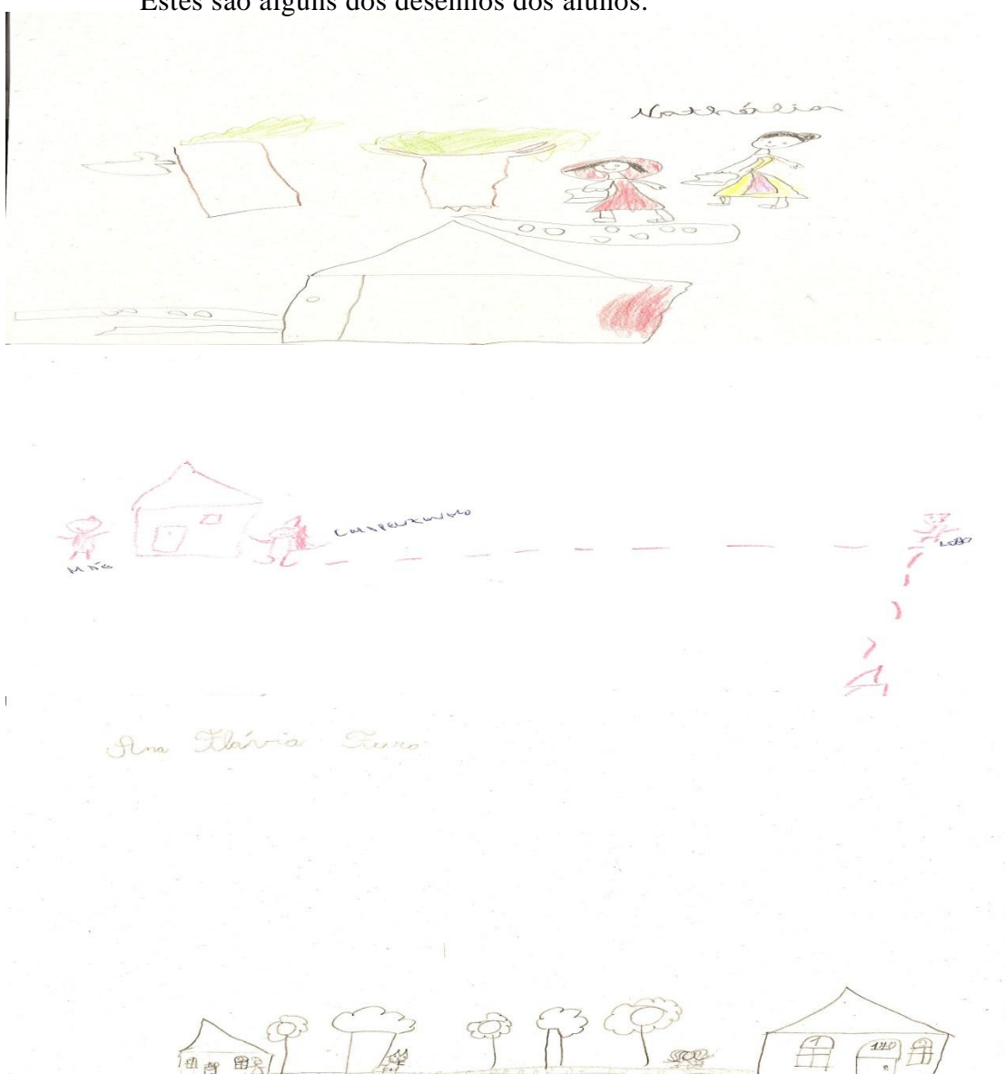
Figura 1 – Desenho de Chapeuzinho Vermelho

Estes são alguns dos desenhos dos alunos.