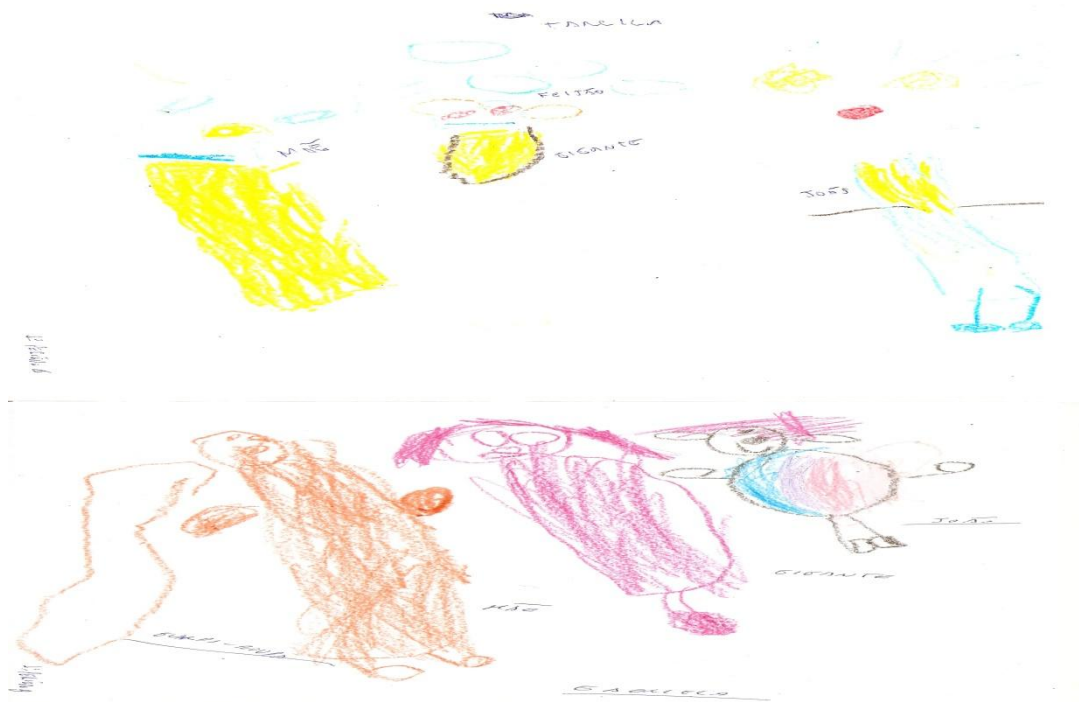
Figura 2 – Desenho de João e o Pé de Feijão

A história de “João e o Pé de Feijão”, foi desenhada pelos alunos da seguinte forma: