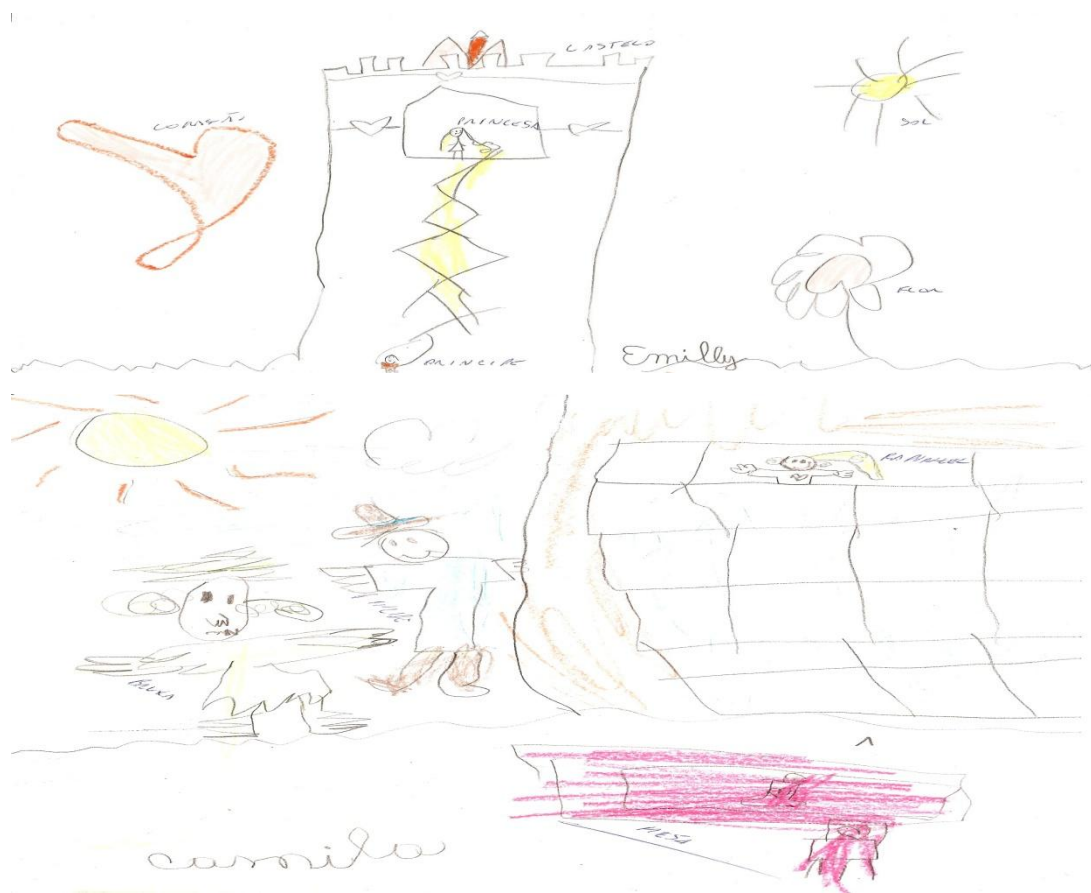
Figura 5 – Desenho de Rapunzel