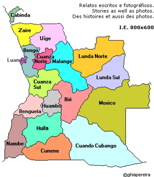
Figura nº 2 - Composição das províncias de Angola

A faixa costeira é temperada pela corrente fria de Benguela. Os Dados Gerais são a sede do Estado Angolano situado em Luanda, a Moeda usada chama-se Kwanza, a Densidade tem 24.3 Hab/Km 2 , o Idioma falado é o Português. As Línguas nacionais faladas são 37 e 50 dialectos. Angola é contituida por dezoito províncias como Benguela, Cabinda, Zaire, Uíge; Luanda, Malange, Cuanza Norte, Cuanza Sul, Cunene, Cuando Cubango, Bengo, Lunda Sul, Lunda Norte, Huila, Namibe, Moxico, Huambo e Bié (ver mapa nº 2).