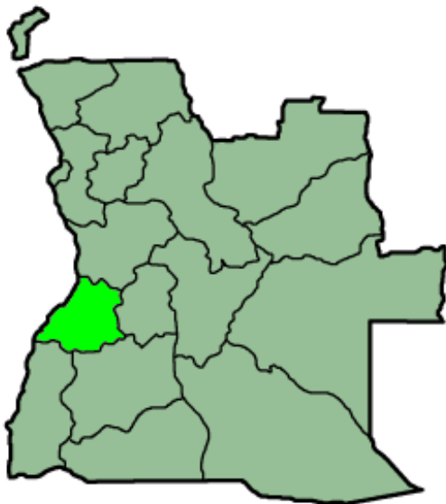
Figura nº 3 – Províncias de Benguela