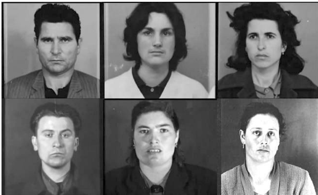
Imagem 3 - Mosaico de retratos do filme 48

Imagem composta por algumas fotografias de registro feitas pela PIDE dos presos políticos, parte do filme 48, cada retrato é mostrado individualmente durante o documentário enquanto se escutam os relatos dos retratados.