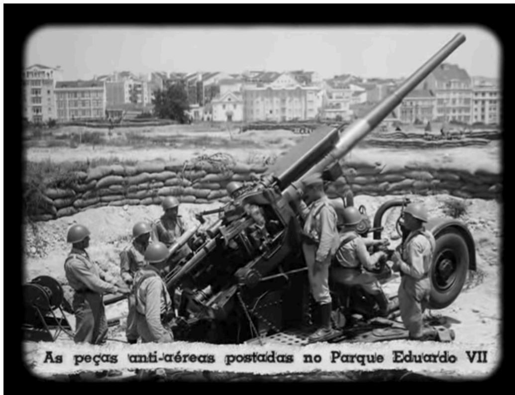
Imagem 4 - Defesa anti-aérea em Lisboa

Anos de 1940, lê-se: "As peças anti-aéreas postadas no Parque Eduardo VII", contradizendo a neutralidade portuguesa na segunda guerra mundial. (Fotograma retirado do filme Fantasia Lusitana , de 2010)