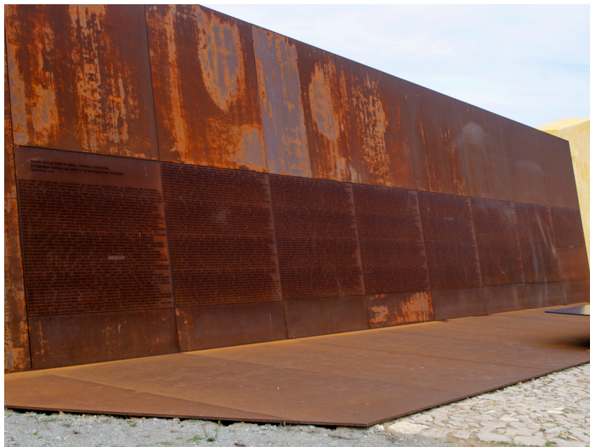
Imagem 12 - Memorial

Estima-se que mais de 2.500 pessoas que estiveram presas no forte de Peniche, e conforme este número cresce em correspondência às investigações, planeja-se gravar novos nomes no metal.