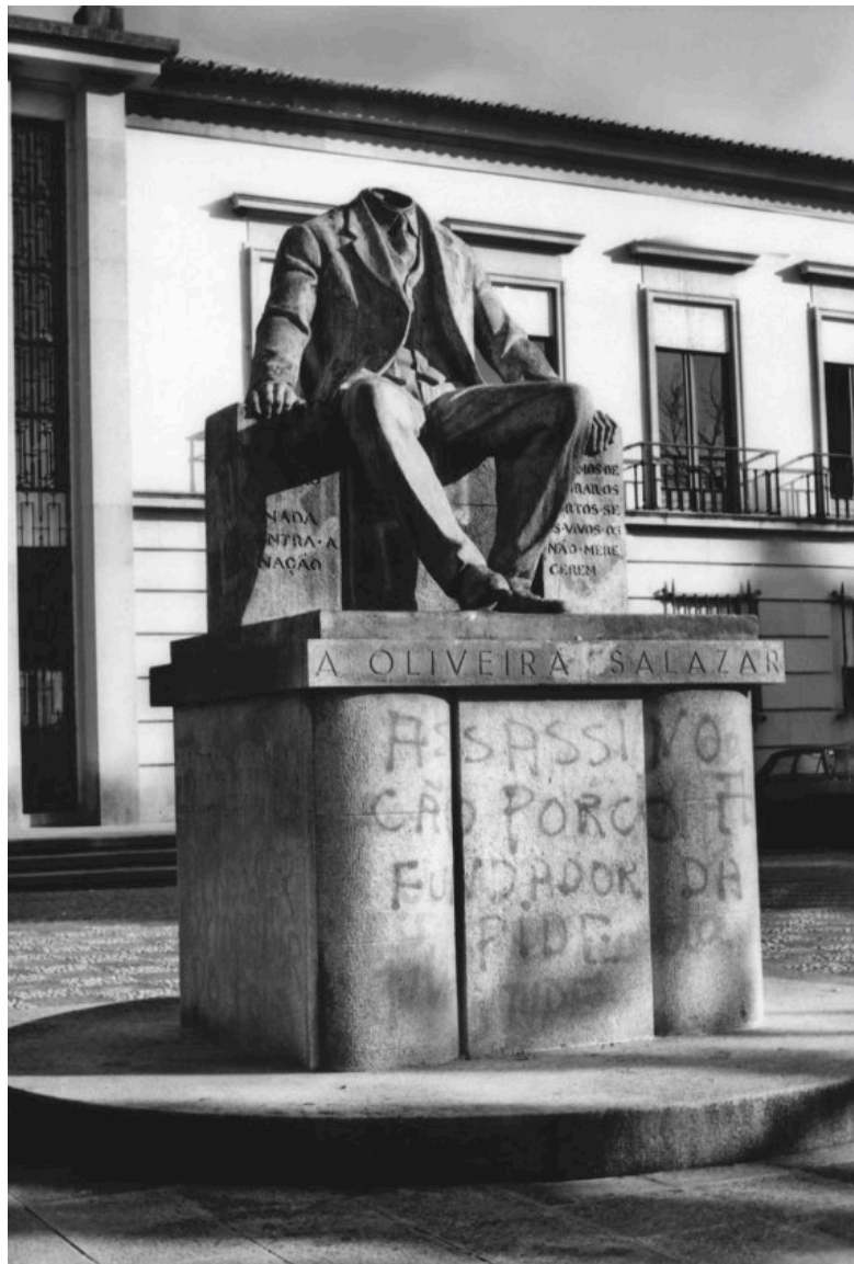
Imagem 9 - Estátua de Salazar decapitada em Santa Comba Dão, Fevereiro de 1975

Esta Imagem que simboliza a queda da ditadura pode ser usada consequentemente como símbolo de vitória da luta de resistência.