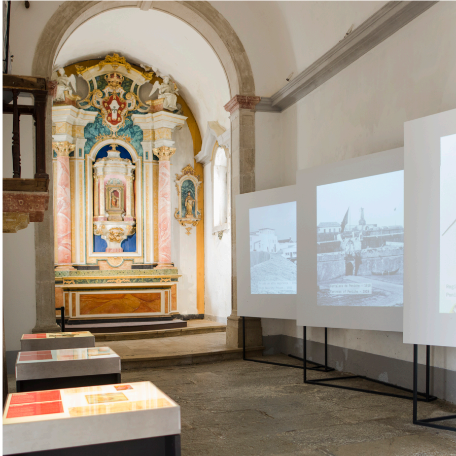
Mesas de luz e projeções compõe a musealização do núcleo sobre a história da fortaleza na Capela de Santa Bárbara, dentro da fortaleza de Peniche.