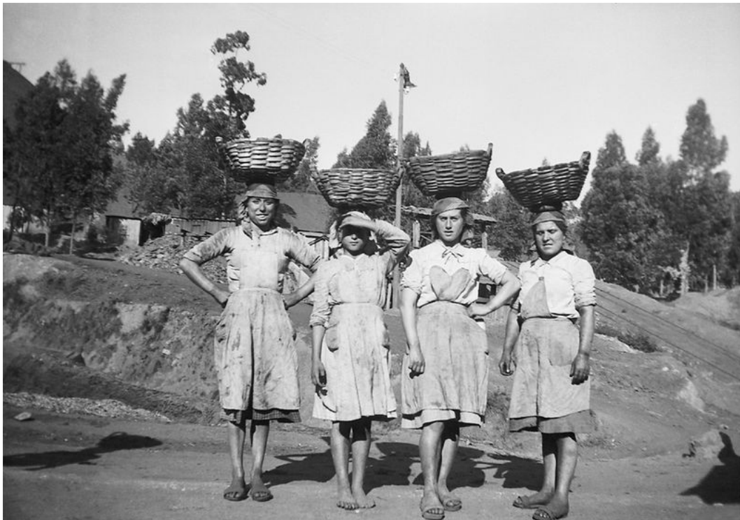
Imagem 2 - Fotografia de Maria Lamas

Jovens trabalhadoras das minas de S. Pedro da Cova, 1948-50. (Recuperado 15 de julho de 2020, de https://alexandrepomar.typepad.com/alexandre_pomar/2009/08/maria-lamas-no-i.html )