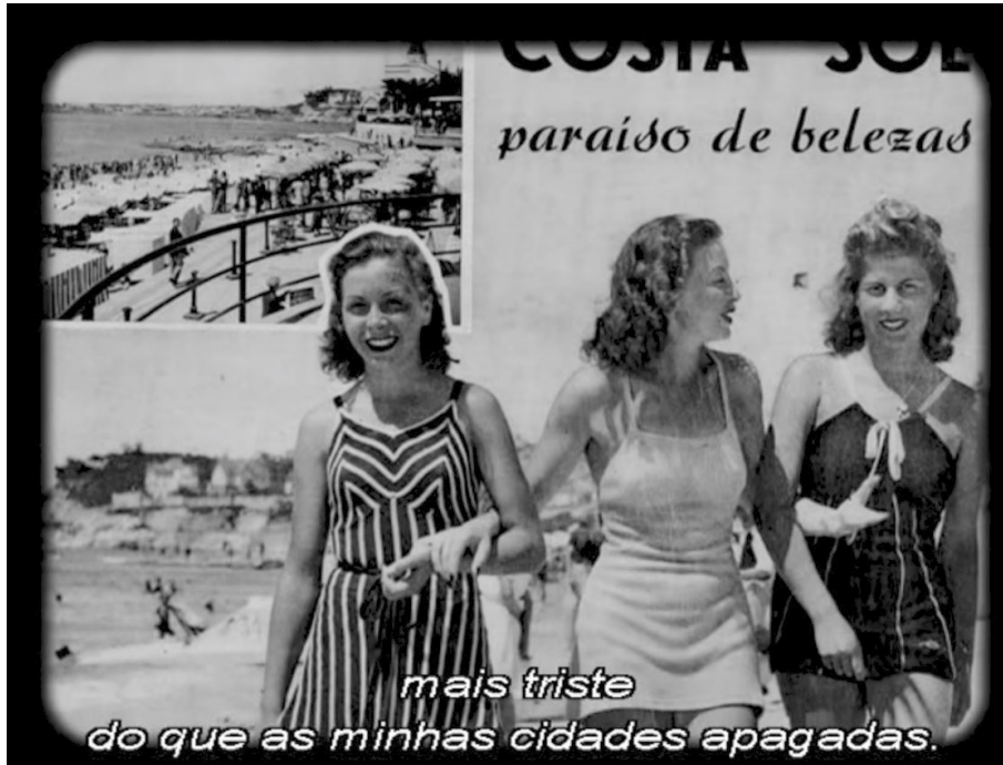
(Fotograma retirado do filme Fantasia Lusitana , de 2010)