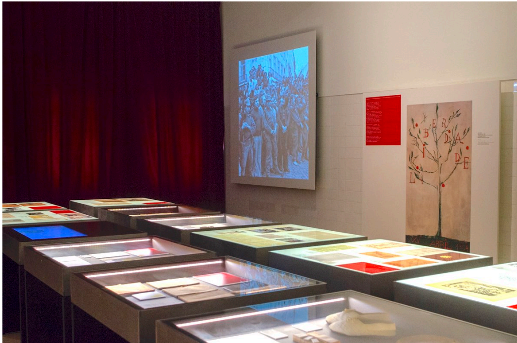
Imagem 18 - Sala principal da exposição 'Por Teu Livre Pensamento'

À frente, as mesas expositivas. Ao fundo, um dos ecrãs/telões de projeção de fotografias e um painel com um cartaz comemorativo do 25 de Abril.