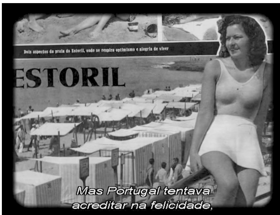
(Fotograma retirado do filme Fantasia Lusitana , de 2010)