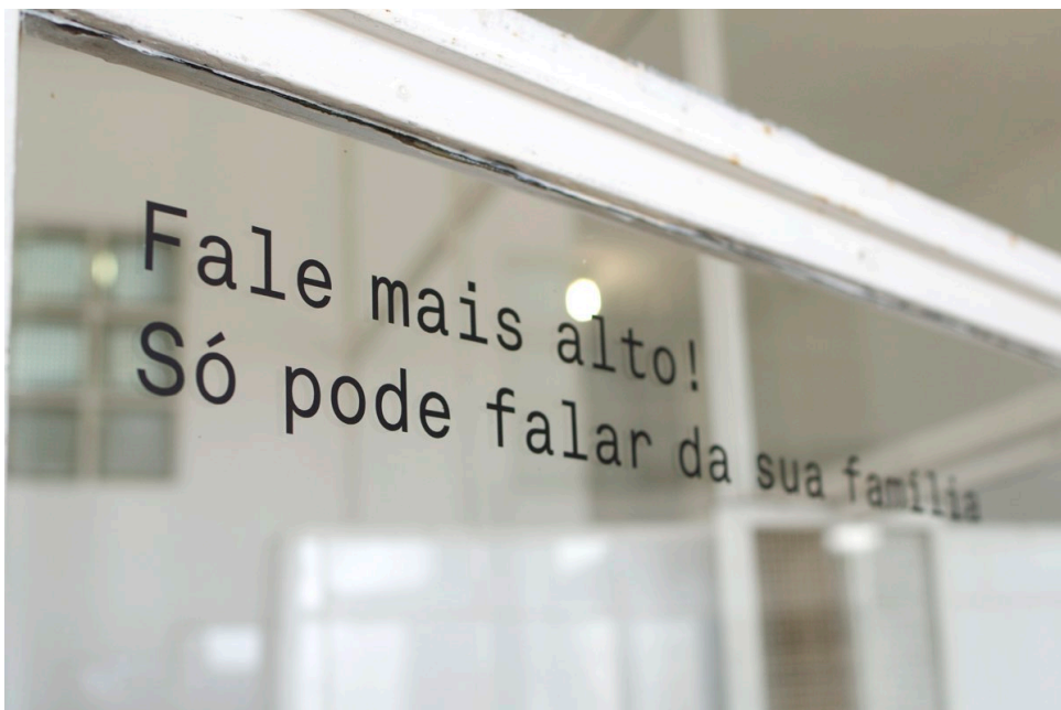
Imagem 16 - Adesivos nos vidros do Parlatório

Nos vidros do parlatório foram adesivadas frases que eram gritadas pelos guardas segundo os testemunhos, numa tentativa de ambientar a sala. Os adesivos são praticamente as únicas intervenções expográficas. (Imagem feita em 16 de Novembro de 2020 pelo autor, no parlatório da fortaleza)