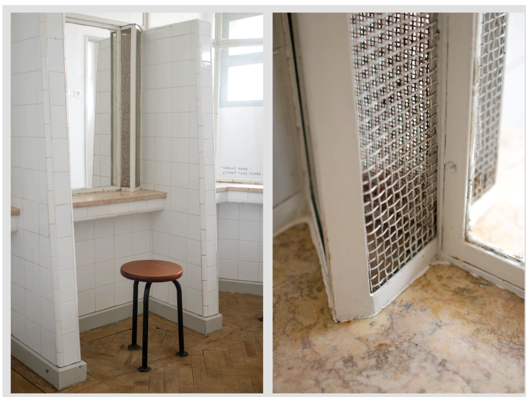
Imagem 15 - Parlatório

Baias no Parlatório ainda com os bancos originais presos ao chão e as grades que impediam o toque entre as pessoas. (Imagem feita em 16 de Novembro de 2020 pelo autor, no parlatório da fortaleza)