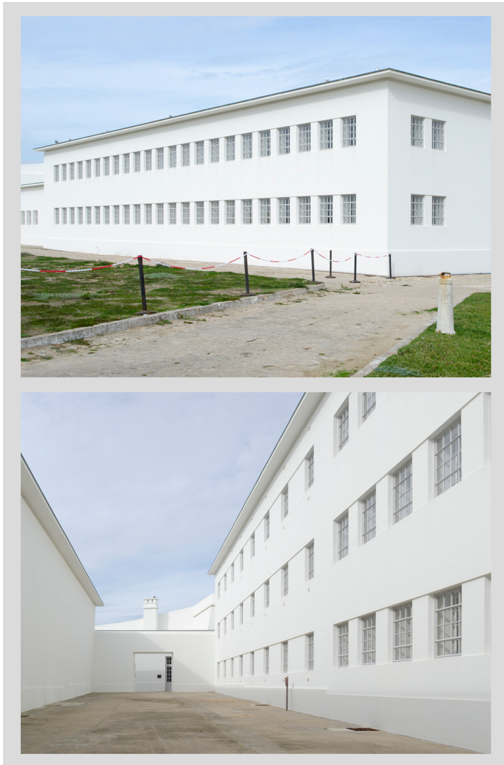
Pavilhões onde estará instalada a exposição de longa duração do MNRL