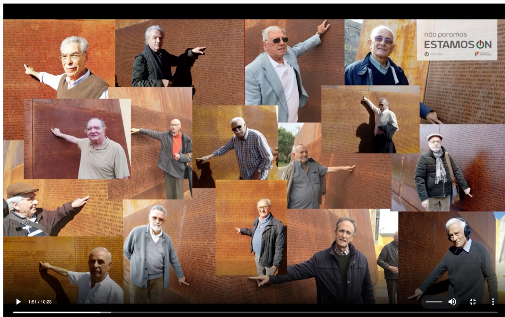
Fotograma de vídeo submetido pela página oficial do MNRL no Instagram (Retirado em 26 de Outubro de 2020 de: https://www.instagram.com/tv/B_ez10XgwUk/ )