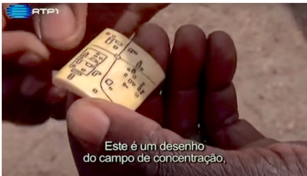
Gravado manualmente em osso de vaca na época do cárcere (Fotograma do filme Tarrafal - Memórias do Campo da Morte Lenta , de 2009)

Ainda sobre o filme 48 de Susana Dias, Viegas lança a questão de como as imagens de arquivo podem ser um ato de resistência. Re-interpretar o arquivo a fim de trazer as memórias à coletividade por meio da arte, impede que o passado seja meramente conciliatório (Viegas, 2014).