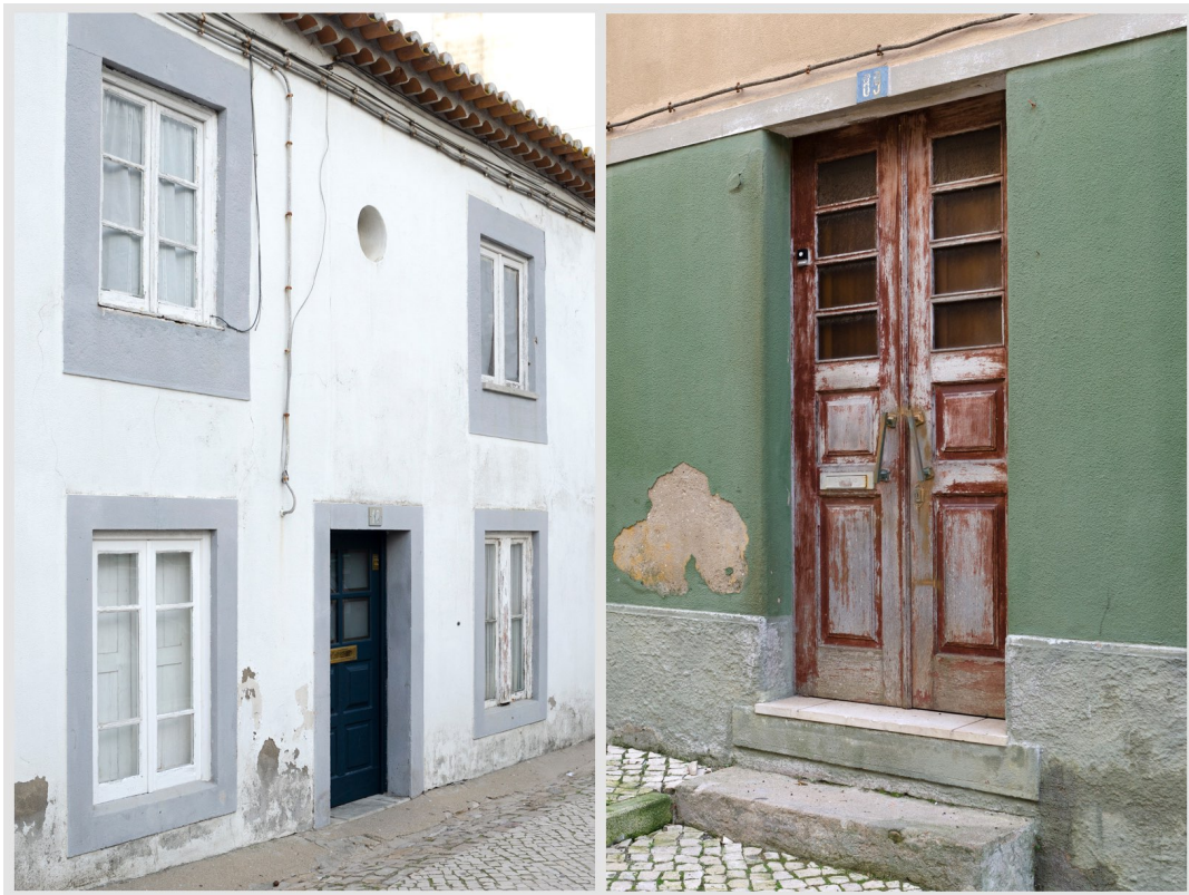
Imagem 27 - Casas de Peniche 2