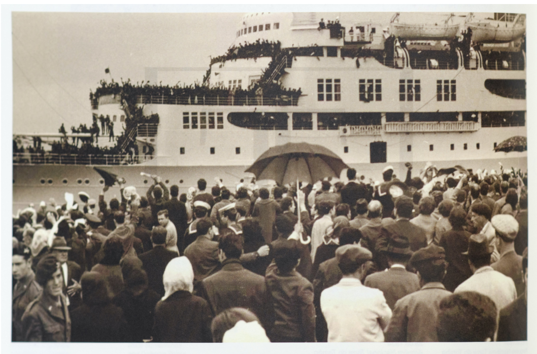
Imagem 23 - Embarque de tropas portuguesas para a Guerra Colonial

Imagem inserida na seção 'Colonialismo e Guerra Colonial' no catálogo da exposição PTLP.