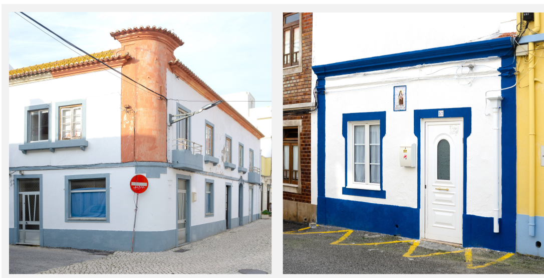
Imagem 26 - Casas de Peniche 1