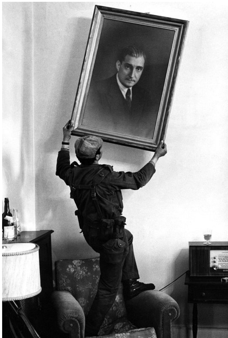
Imagem 10 - Imagem de Salazar sendo retirada

Acontecimento do dia no dia 26 de Abril de 1974 numa das sedes da PIDE. Esta imagem integra a exposição 'Por Teu Livre Pensamento' do MNRL.