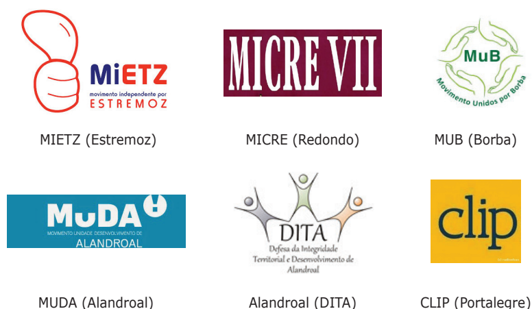
Fig. 2. Logotipos dos movimentos independentes estudados

Quanto ao manuseamento das Tecnologias de Informação e Comunicação (TICs) temos a assinalar a unanimidade relativa à sua adesão. Todos os movimentos tiveram site próprio, todos recorriam a um perfil nas redes sociais (Facebook) nas quais publicitavam o seu logotipo como imagem identitária e de distintividade.