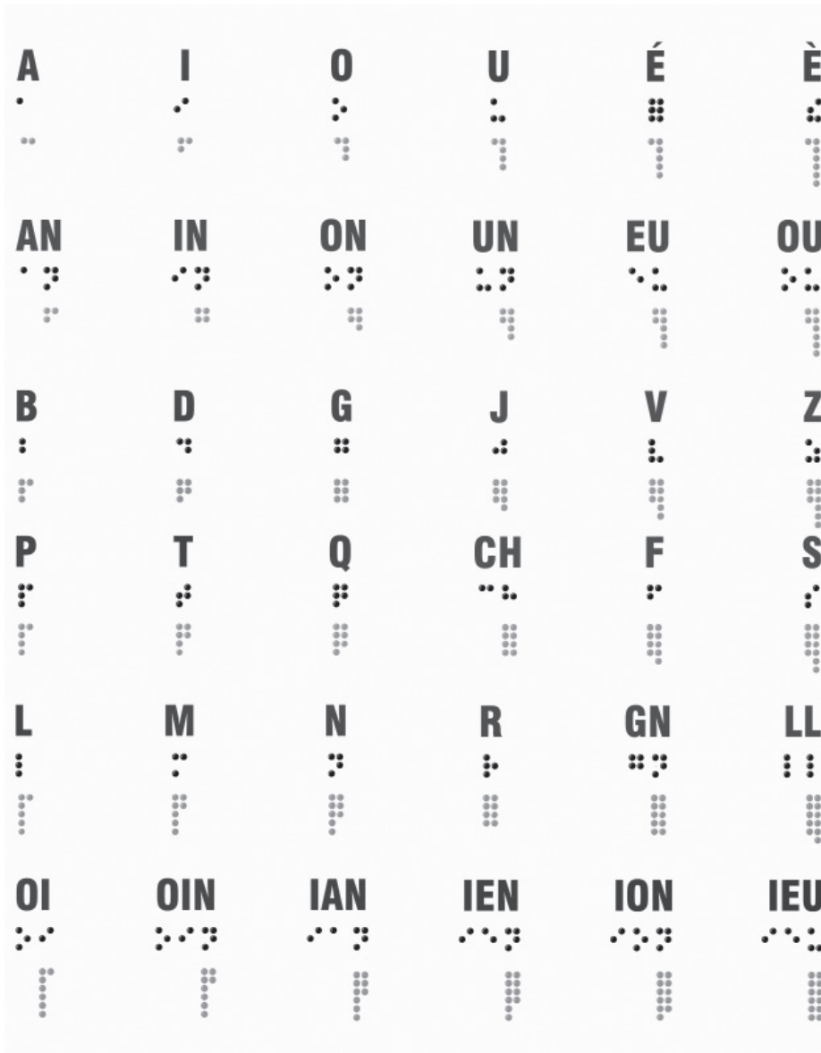
Sonografia Barbier Adaptado à Escrita dos Cegos, in: Guerreiro, 2011b: 25

um seis sinais e formando igual número de colunas, conforme a evolução sonográfica no quadro seguinte: