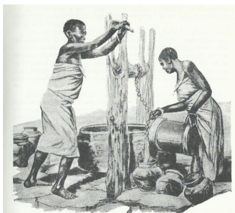
Ilustração 6 - Mulheres em volta do poço (in provérbios chnaganas, 1998)

A sustentabilidade do centro, entre 2010 e 2012 foi parcialmente assegurada através da sua manada, que serviu de banco social. Através da venda das cabeças de gado excedentárias torna-se possível pagar as despesas correntes - os pastores, a alimentação das famílias e criar ainda um pequeno fundo para investimento nas outras actividades. A compra da manada resultou também de um projecto onde foram adquiridas cinquenta cabeças para reprodução com o objectivo de introduzir o fomento pecuário. A venda é