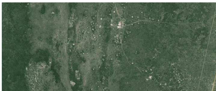
Ilustração 4- Povoamento da aldeia de Djabula, Matutuíne.

Um elemento particularmente significativo desta época encontra-se no Museu de História Natural. Trata-se duma colecção de fetos de elefantes, onde se apresenta a evolução do feto ao longo de 24 meses de gestação. Importante testemunho para a ciência, estes objectos são testemunho duma tragédia ecológica “pela matança generalizada de elefantes ao longo dos anos 50. As caçadas dos colonos, para além do divertimento gratuito, procuravam eliminar a presença de animais “selvagens”, em particular das mandas de elefantes, que com a sua presença impediam o aproveitamento agrícola dos solos de aluvião. O saldo da colonização foi violento, produzindo uma desflorestação acentuada, uma reorganização do uso do solo e a movimentação de populações contra a sua vontade.