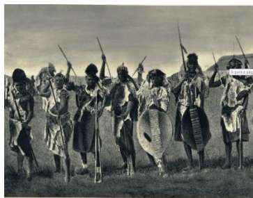
Ilustração 3 Indígenas do Sul de Mozambique. in Rufino, Santos (1929) Álbuns Fotográficos da Colónia de Moçambique

Em termos de povoamento, a região regista na memória local os movimento das populações Tembe nos finais do século XIX, que se deslocavam das zonas de influência Zulu, no sudeste africano. A língua usada pelos seus habitantes resulta duma influência Tsonga e Nguni. Os Nguni são povos guerreiros, criadores de gado, que ocuparam a região sudeste do continente. Por seu turno a língua Tsonga constitui um grupo linguístico complexo que é classificada na família Tswa-Ronga. Em Moçambique, têm diversas variantes. É por vezes conhecida como Changana ou Ronga. A tradição pecuária marca as práticas das comunidades em conjunto com a agricultura de pequenos produtos para consumo. São práticas que exigem territórios de pastagens relativamente extensos, e áreas agricultáveis de proximidade. A defesa das manadas, contra estranhos contra os animais selvagens marcaram durante o final do século seculo XIX as formas de relacionamento destas comunidades com o espaço.