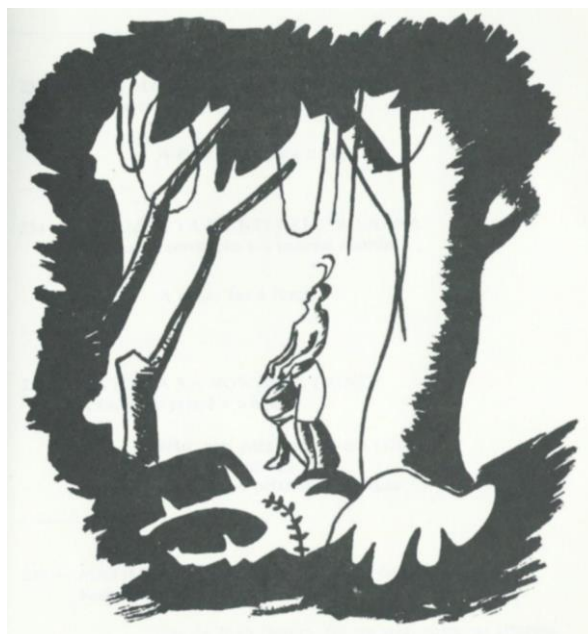
Ilustração 8 - Tambor (in Provérbios Changana, 1998)

O objectivo do projeto passa por facilitar as condições para os membros da comunidade terem consciência dos conhecimentos e das técnicas necessárias para se organizarem e atingirem os seus objectivos. Procura-se através dos procedimentos de criação inclusiva evitar a oferta de soluções exteriores, privilegiando o reconhecimento a partir de dentro dos elementos da comunidade.