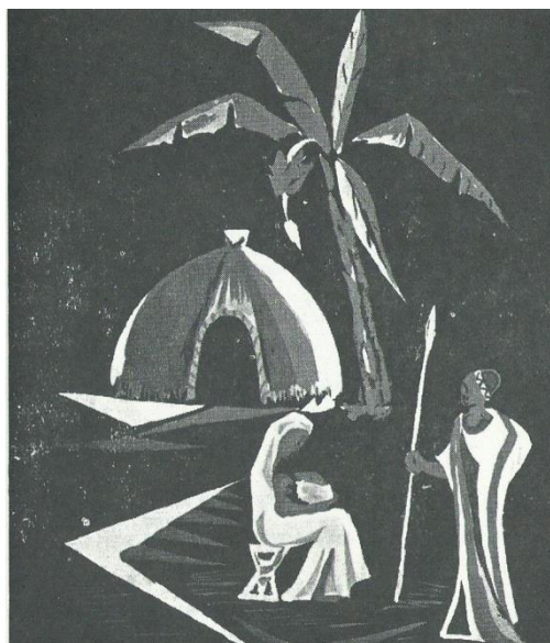
Ilustração 7 - Aldeia (in Provérbios Changana, 1998)

Os defensores do investimento nos chamados actores privilegiados, concentrando o investimento da ajuda ao desenvolvimento em novas dinâmicas, procuram potenciar o efeito multiplicador do investimento. Nestes casos há uma