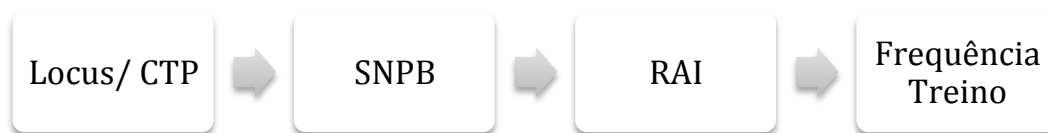
Figura 3: modelo de variáveis que influência a frequência/ adesão ao exercício físico a testar nas regressões

Por último as regressões múltiplas serviram de base para analisar a influência de cada uma das variáveis para a predição da frequência de treino, integradas dentro do modelo contínuo proposto pela TAD (fig. 3). Optámos por utilizar a variável RAI (Índice de Autonomia Relativa), (Puente & Anshel, 2010), que representa uma medida síntese do grau de regulação motivacional. Esta opção teve como base a intenção de aumentar o poder explicativo do modelo testado, tendo em vista a dimensão da amostra.