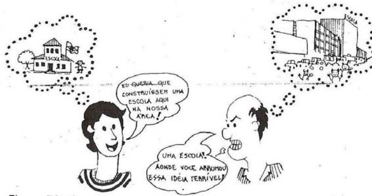
Figura 3 - A percepção é processo selectivo e depende de factores como os valores socioculturais e individuais;